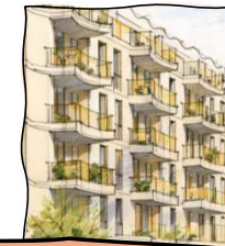
Gevels & Uitstraling